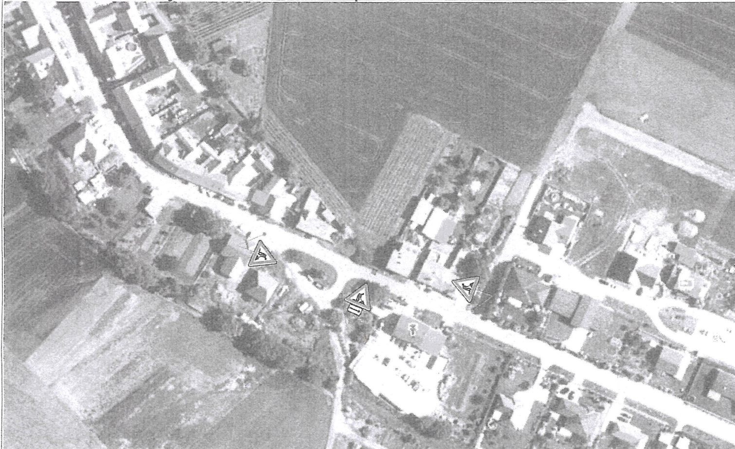
Detail zúženého profilu